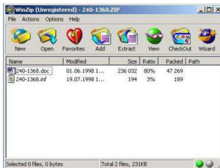
Рисунок 2 Диалоговое окно программы-архиватора WinZip